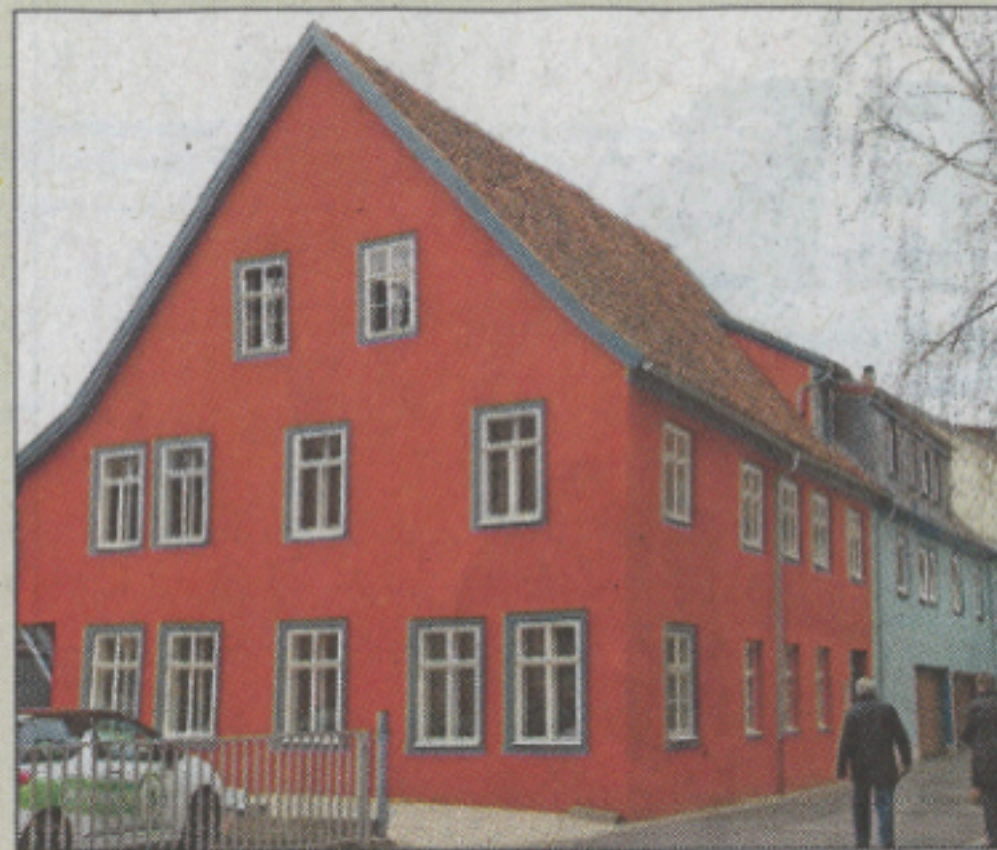
Medaille: Anwesen Kleine Judengasse 4.