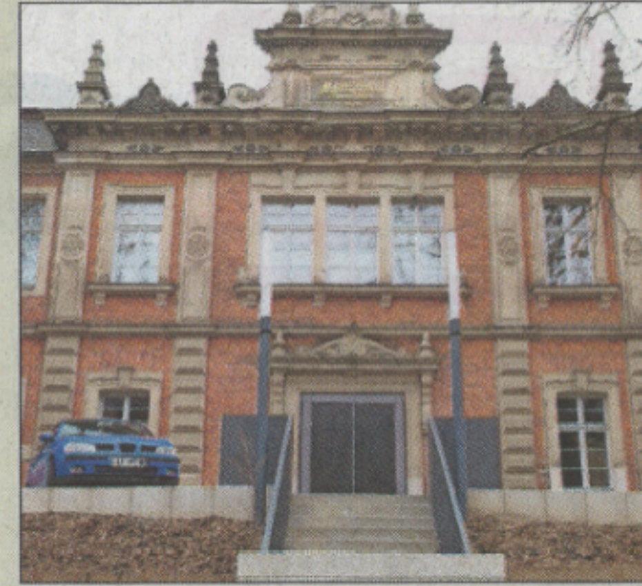
Medaille: Marstall, Landesvermessungsamt