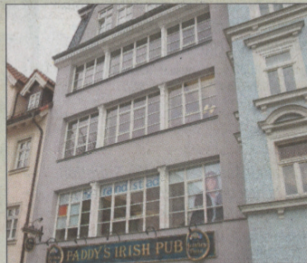
Urkunde: Anwesen Mauer 2.