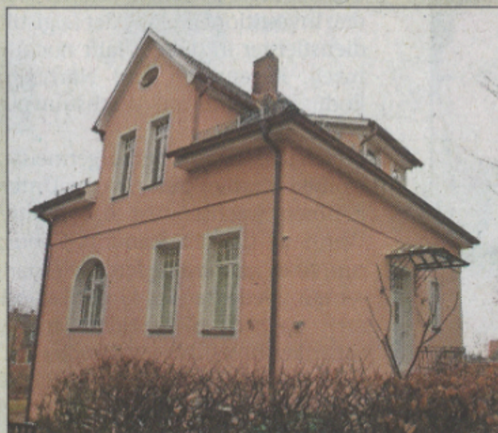
Urkunde: Festungsstraße 9c, umfassend saniert.

Am 6. März 1991 hat die Stadt beschlossen, gelungene Altbausanierung mit Urkunden und Medaillen auszuzeichnen. cw