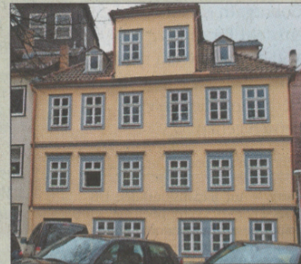
Urkunde: Rückfront des Hauses Steinweg 8.